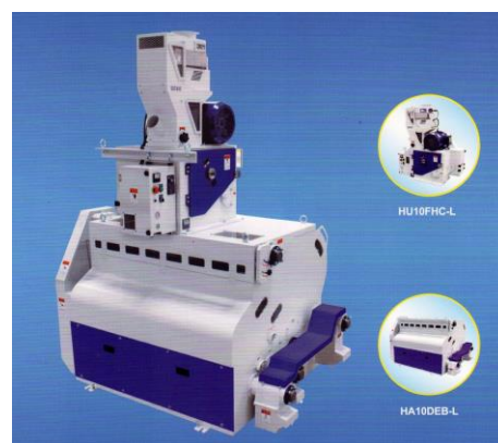
Descascaradora y aventadora de cascarilla