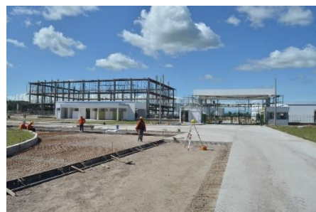
Construcción de la Planta de Secado y Almacenamiento Almacenamiento en Puerto López