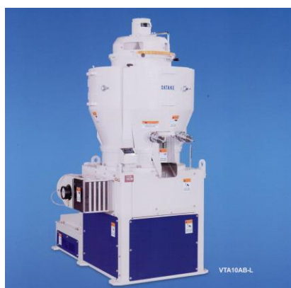
Blanqueadora vertical de arroz