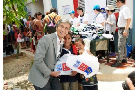
Donación de prendas de vestir por parte de Fast Retailing (UNIQLO and GU)