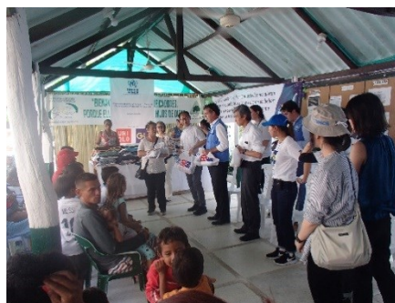
Donación de prendas de vestir por parte de Fast Retailing a la Casa del Abuelo in Riohacha