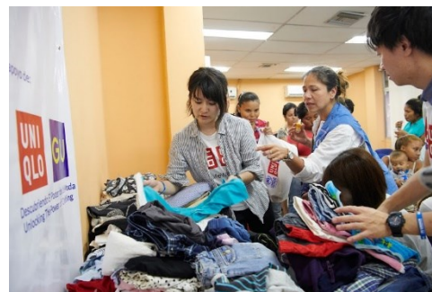
Donación de prendas de vestir por parte de Fast Retailing (UNIQLO and GU)