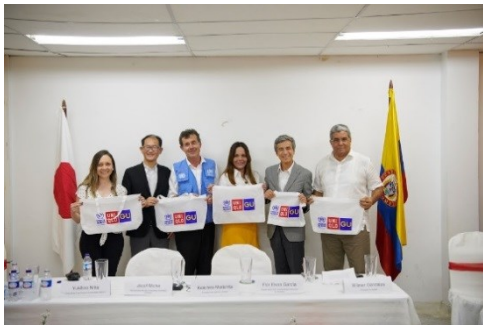
Entrega Oficial Hospital Nuestra Señora de los Remedios en Riohacha