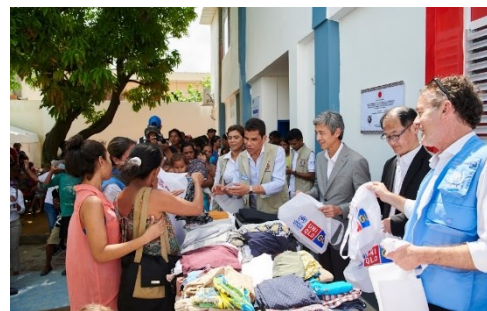
Donación de prendas de vestir por parte de Fast Retailing (UNIQLO and GU)