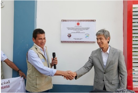
Entrega oficial en el Centro de Atención al Migrante de la Pastoral Social en Maicao