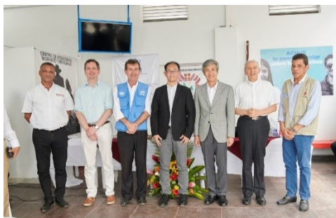
Entrega oficial en el Centro de Atención al Migrante de la Pastoral Social en Maicao