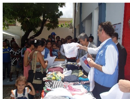
Donación de prendas de vestir por parte de Fast Retailing (UNIQLO and GU)