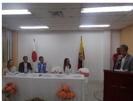
Entrega Oficial Hospital Nuestra Señora de los Remedios en Riohacha

La madre de una bebé venezolana dijo, "llevo en Colombia ya dos años y nunca me habían tratado como hoy. Yo estaba enferma y por esto vine al hospital. Ahora, recibí prendas de vestir muy lindas para mi bebé y para mí, lo cual agradezco mucho".