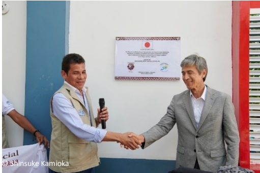
記念プレートの除幕

同県マイカオ市では、「マイカオ市難民移民支援センター」において合同供与式を開催しました。同センター（団体名：パストラル・ソシアル・リオアチャ事務局）に対しては、UNHCR は一時滞在者用の宿泊施設の増設、日本国大使館は寝具、調理器具、簡易診療キットの供与やトイレ等の整備に対する支援、ファーストリテイリングは服の寄贈を行いました。