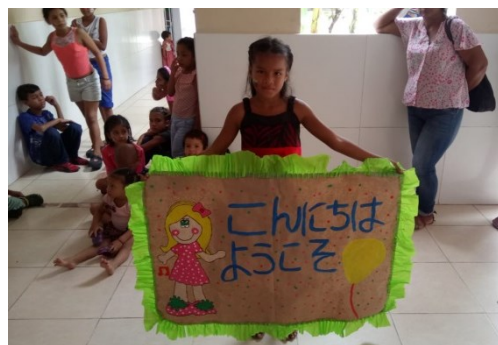
ククタ市移民センターにおける合同供与式