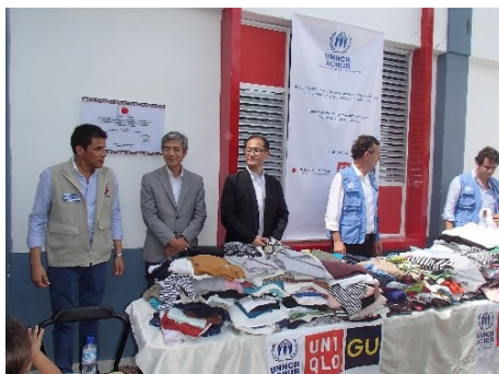
マイカオ市難民移民支援センターにおけるファーストリテイリングによる服の寄贈

加えて、ファーストリテイリングは同センターにてベネズエラ難民・移民一人一人に服を届けました。