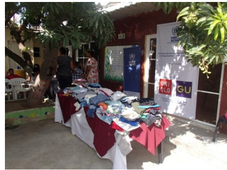
家族福祉庁リオアチャ事務所におけるファーストリテイリングによる服の寄贈