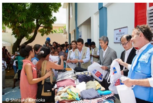
マイカオ市難民移民支援センターにおける ファーストリテイリングによる服の寄贈