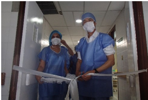
手術室でテープカットを行う森下大使

続いて、リオアチャ市では、「リオアチャ市ヌエストラ・セニョーラ・デ・ロス・レメディオス病院」において合同供与式を開催しました。同病院に対しては、UNHCR は小児用ベッド、輸液ポンプ、マルチパラメータモニター、日本国大使館は手術室用医療器具一式の供与を、ファーストリテイリングは服の寄贈を行いました。