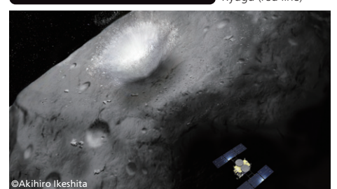
衝突装置により人工的なクレータができた瞬間(イメージ) 「はやぶさ2」は小惑星の背後に回り込み、破片を回避する Moment of creation of an artificial crater by SCI (conceptual drawing). Hayabusa2 hides behind the asteroid to avoid collision with fragments.