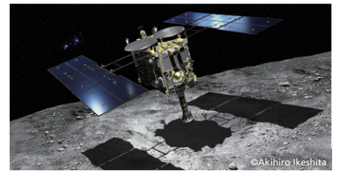
自動・自律システムを駆使して人工クレータ周辺のサンプル採取に向かう「はやぶさ2」(イメージ) Hayabusa2 heading toward an artificial crater for sampling, controlled by its automatic and autonomous system (conceptual drawing)

http://global.jaxa.jp/projects/sat/hayabusa2/