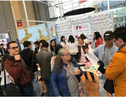
PERIODISMO Y MEDIOS EN JAPÓN: la experiencia de una becaria